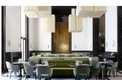
Monsieur Bleu - Palais de Tokyo

Ce restaurant branché offre une vue imprenable sur la Tour Eiffel et propose une cuisine française moderne respectant la saisonnalité des produits. Parfait pour un apéritif chic avant le match dans un esprit art déco signé Joseph Dirand et propose.