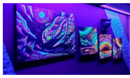
Paint in The Dark

C'est un atelier où il s'agit de peindre dans le noir! Le concept est tout simplement unique. Plongé.e.s dans l'obscurité et à l'aide de peinture phosphorescente, il vous faudra faire preuve de créativité, afin de créer une œuvre d'art que vous pourrez rapporter chez vous après l'expérience.